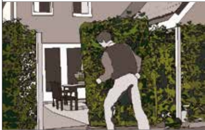
12.00h Disfrutar de una pared verde instantánea