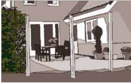
9.35h Plantación de paneles y fijación a los postes