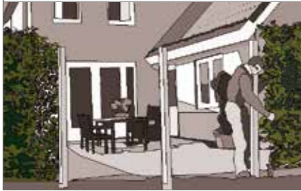
11.15h Plantación y fijación de la última Valla Verde